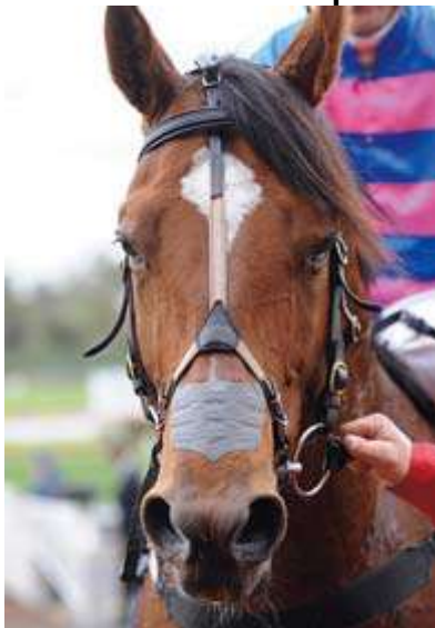
Bit avec cuillères